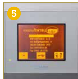
PLC PER LA GESTIONE AUTOMATICA DEL PROCESSO DI PRODUZIONE E LA MEMORIZZAZIONE DI RICETTE