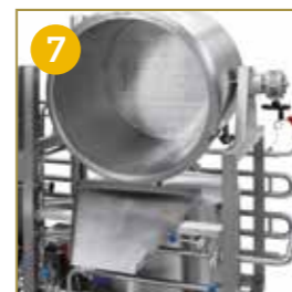
RIBALTAMENTO TINO FILTRO PER ESTRAZIONE TREBBIE