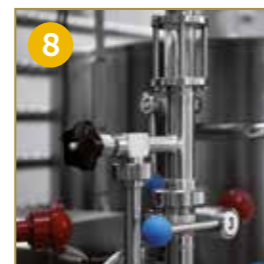
REGOLAZIONE FILTRAZIONE CON VALVOLA MICROMETRICA E SPECOLA VISIVA