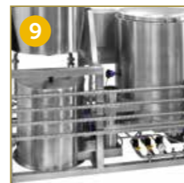
SCAMBIATORE TUBOLARE INTERCAMBIADOR TUBULAR

> CATEGORIA DI PRODOTTO / CATEGORÍA DE PRODUCTO