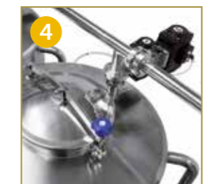
GESTIONE AUTOMATICA TRAMITE VALVOLE PNEUMATICHE GESTIÓN AUTOMÁTICA MEDIANTE VÁLVULAS NEUMÁTICAS