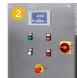
PANNELLO ELETTRICO CON PLC PANEL ELÉCTRICO CON PLC