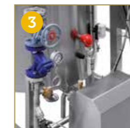
GRUPPO DI RISCALDAMENTO A VAPORE GRUPO DE CALENTAMIENTO A VAPOR